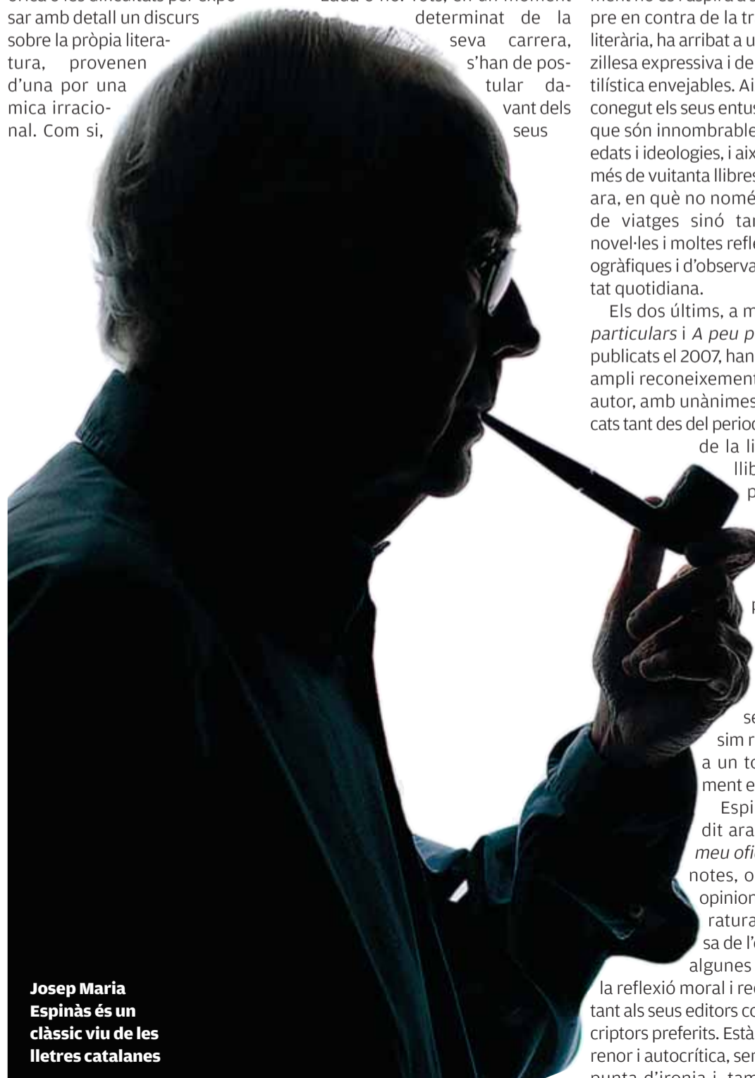
Josep Maria Espinàs és un clàssic viu de les lletres catalanes