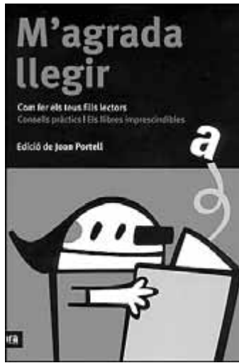
Joan Portell (edició). Josep M. Aloy, Jaume Cela, Teresa Duran, Pep Molist, Anna Nolla i Montse Segarra (articles), M'agrada llegir . ARA LLIBRES. Barcelona, 2004.

Harry Potter arrossega aquest llast. I també el llast, segons en quins capítols, d'un discurs entretingut, repetitiu, que es va fent més evident a mesura que avança la sèrie –el cinquè volum ja té 968 pàgines!–, i que fa que, al llarg del gruix acumulat de 2.800 pàgines, no es pari de donar voltes i voltes, en una mena de remolí, sobre el mateix conflicte del qual, l'autora, per exigències de l'èxit, difícilment podrà fugir.