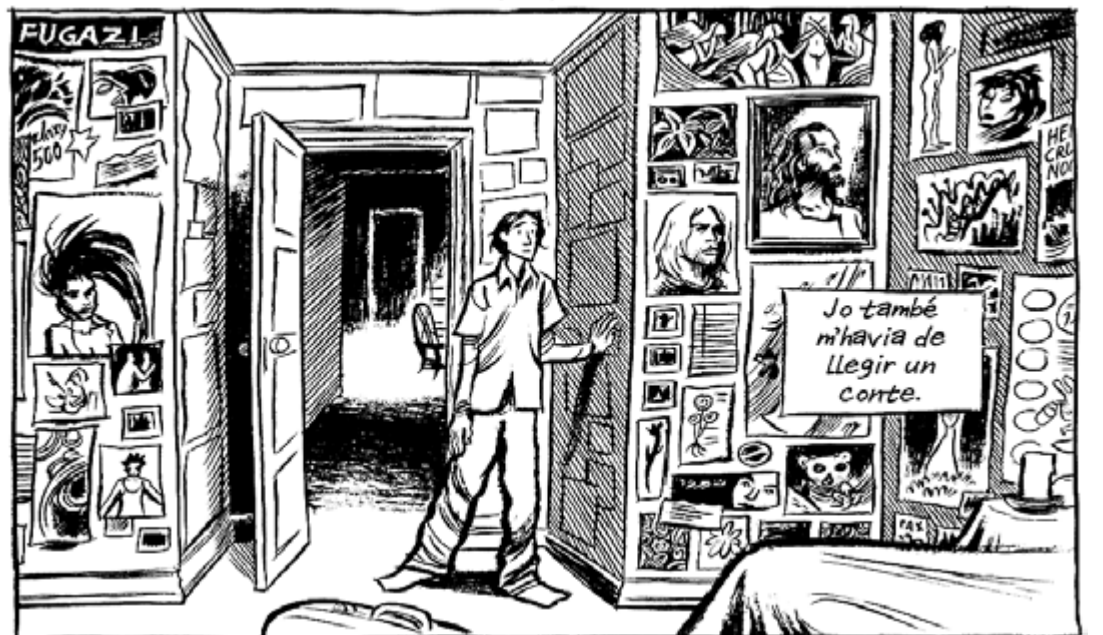
UNA DE LES ILLUSTRACIONS DE LA VERSIÓ CATALANA DE 'BLANKETS'

món que envolta el protagonista i del qual se sent exclòs excepte en el camp de la religió. De la mateixa manera, la crisi amb aquest pes educatiu es resol de manera ràpida i sense aprofundir gaire, deficiències que també presenta la resolució narrativa del trencament de la relació amorosa; la mort per inanició d'aquesta relació voreja l'ensopiment, potser per la dificultat de trobar el to dramàtic adequat. Una obra interessant, que afegeix l'al·licient de la seva publicació simultània en català i castellà, a la qual, però, pot perjudicar una campanya prèvia desproporcionada pels mèrits reals que té.